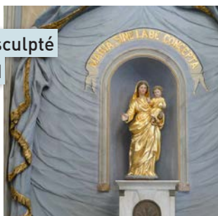
Panneau en bois sculpté de la chapelle sud