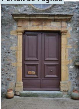
Portail de l'église